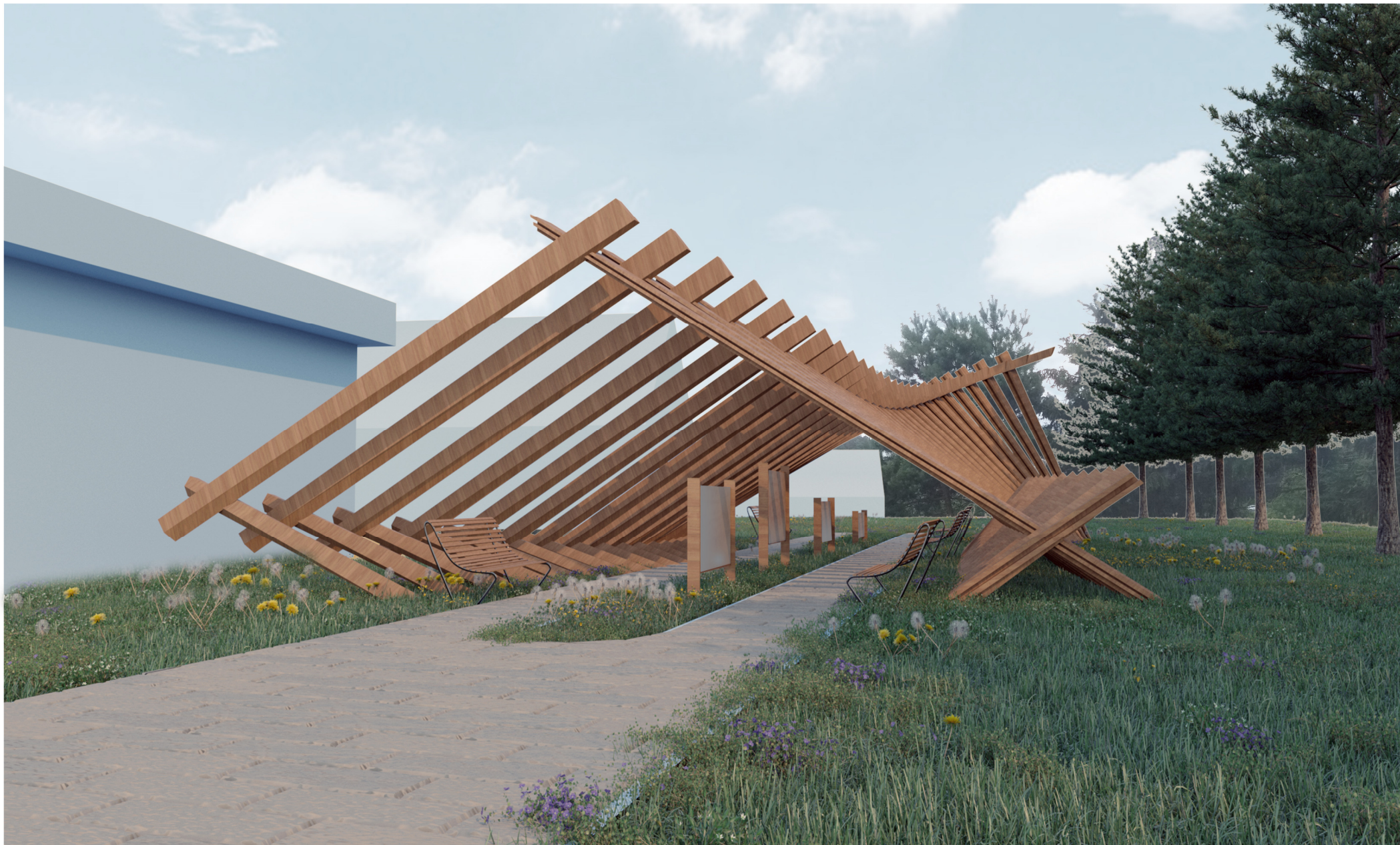
WIZUALIZACJA PRZEDSTAWIAJĄCA PROPONOWANĄ INSTALACJĘ ARTYSTYCZNĄ