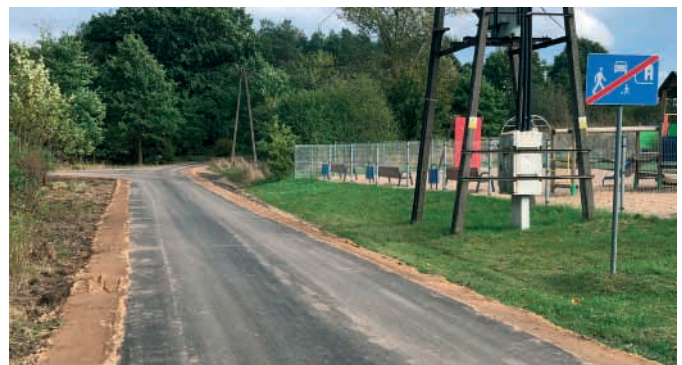
Borc – ul. Starowiejskiej 90 mb