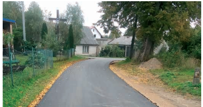
Rybaki – 165 mb przy szer. 3,5 m