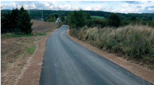
Piotrowo – 200 mb w kierunku Grabowa Kościerskiego