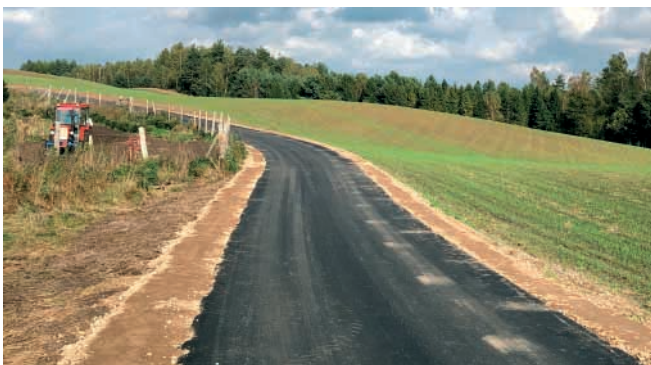
Starkowa Huta – 145 mb przy szer. 3,5 m